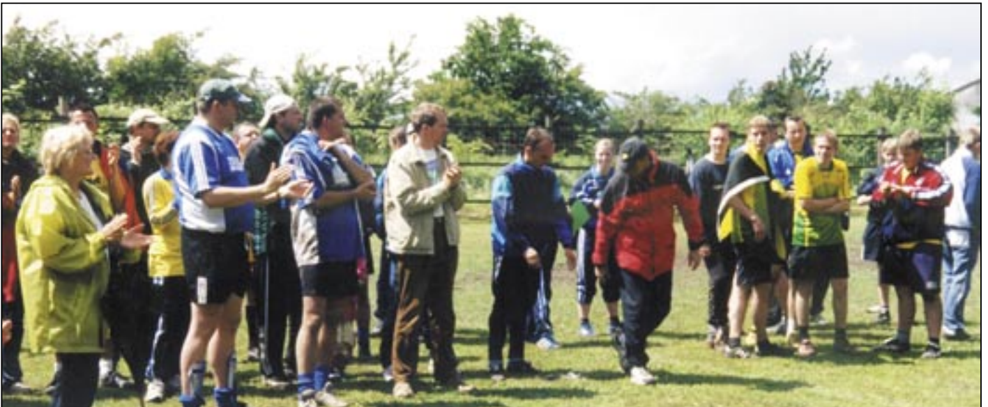
Die klatschnassen Fußballer warten auf die Siegerehrung