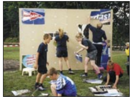
Gar nicht so einfach, das Puzzle hinzukriegen

krogs“ zuständig. Oder aber eine gemütliche Kaffeepause mit selbstgebacken Kuchen, angeboten von den Müttern des Naturkindergartens.