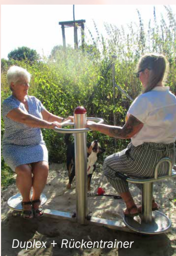
Duplex + Rückentrainer